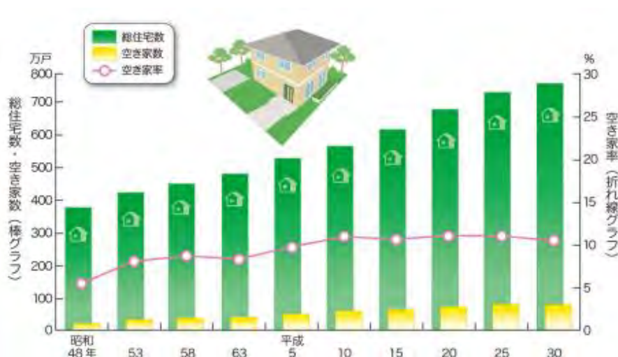
東京都の総住宅数、空き家数及び空き家率の推移

空き家を放置すると、雑草が伸びて景観が悪化するという住宅環境の悪化や老朽化による家屋の倒壊、不法侵入や不法占拠などの犯罪リスクの増加による治安の悪化などに影響を与えるため、空き家は社会問題化しています。